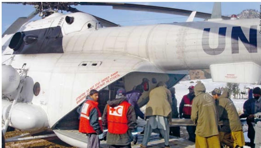
Cruz Roja Americana