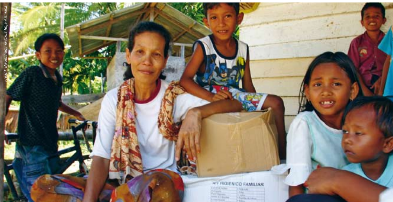
Fredrik Barhemmar/Cruz Roja Alemania

Las Sociedades Nacionales procuran alcanzar la excelencia en lo que hacen y están empeñadas en crecer de manera sostenible, porque desean hacer más por las personas vulnerables. Las Sociedades Nacionales definen las características esenciales que las hacen efi-