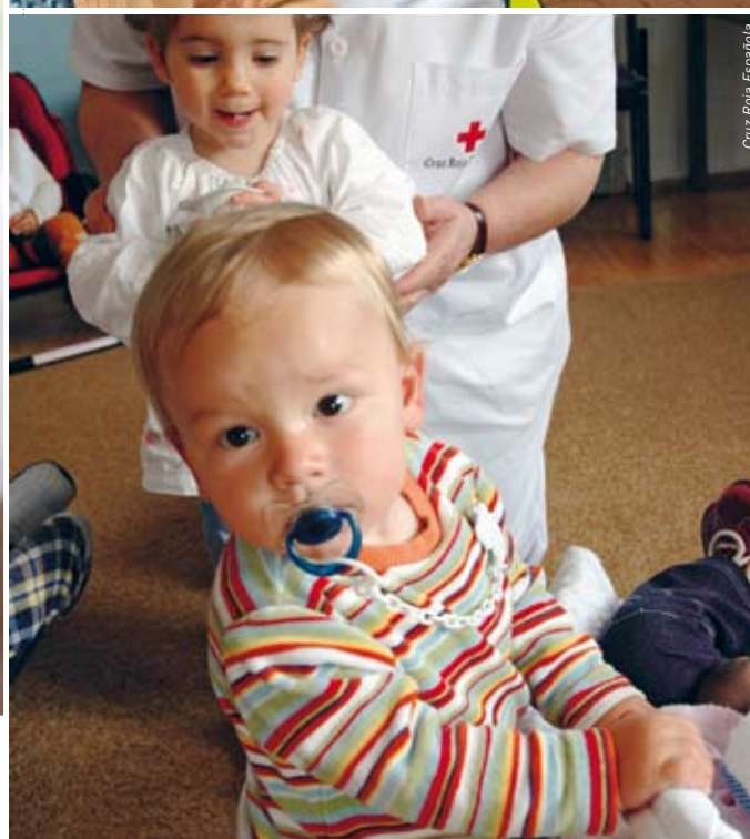
Cruz Roja Española

tensiones de manera pacífica. Hacemos frente activamente al prejuicio social y alentamos la tolerancia y el respeto de las muchas perspectivas diferentes que cabe esperar en un mundo diverso. Ello incluye emprender iniciativas de sensibilización en favor de la adopción de enfoques no violentos para salvar estas diferencias y anticipar la aparición de conflictos violentos.