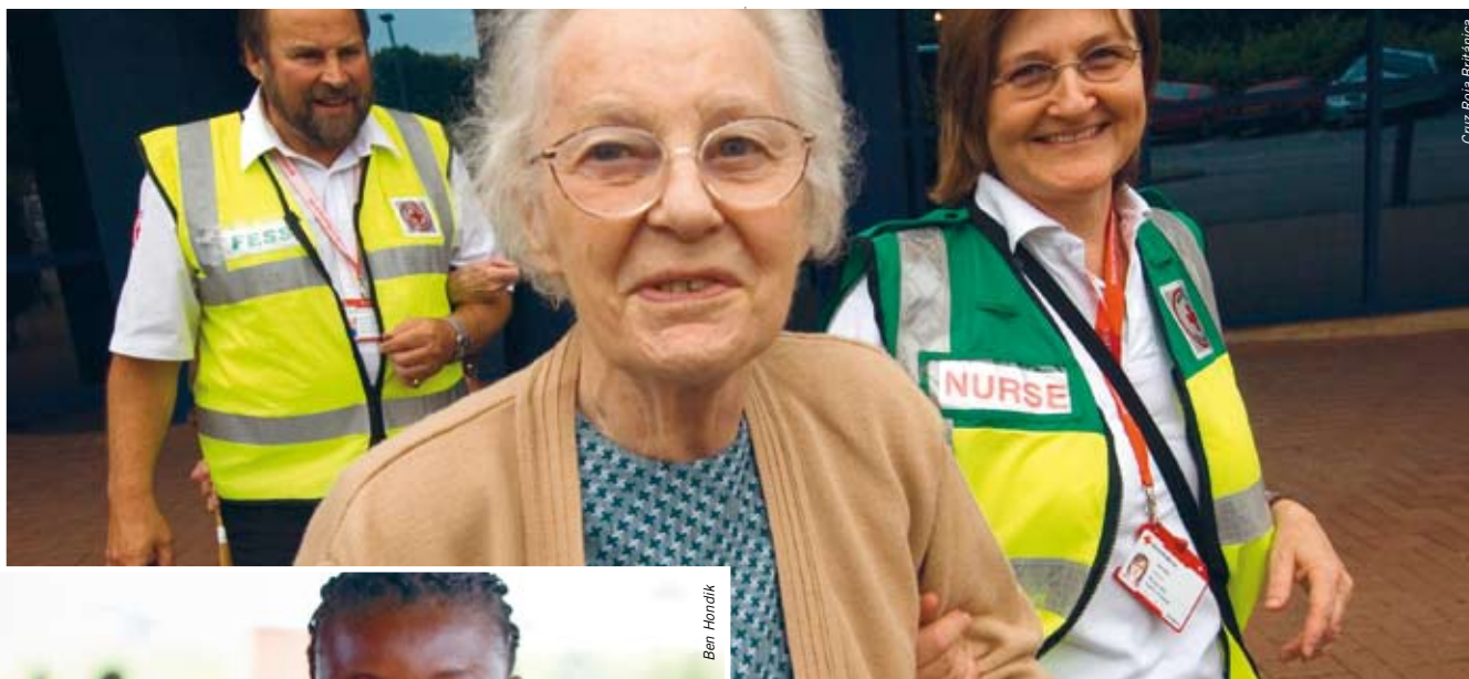
Cruz Roja Británica