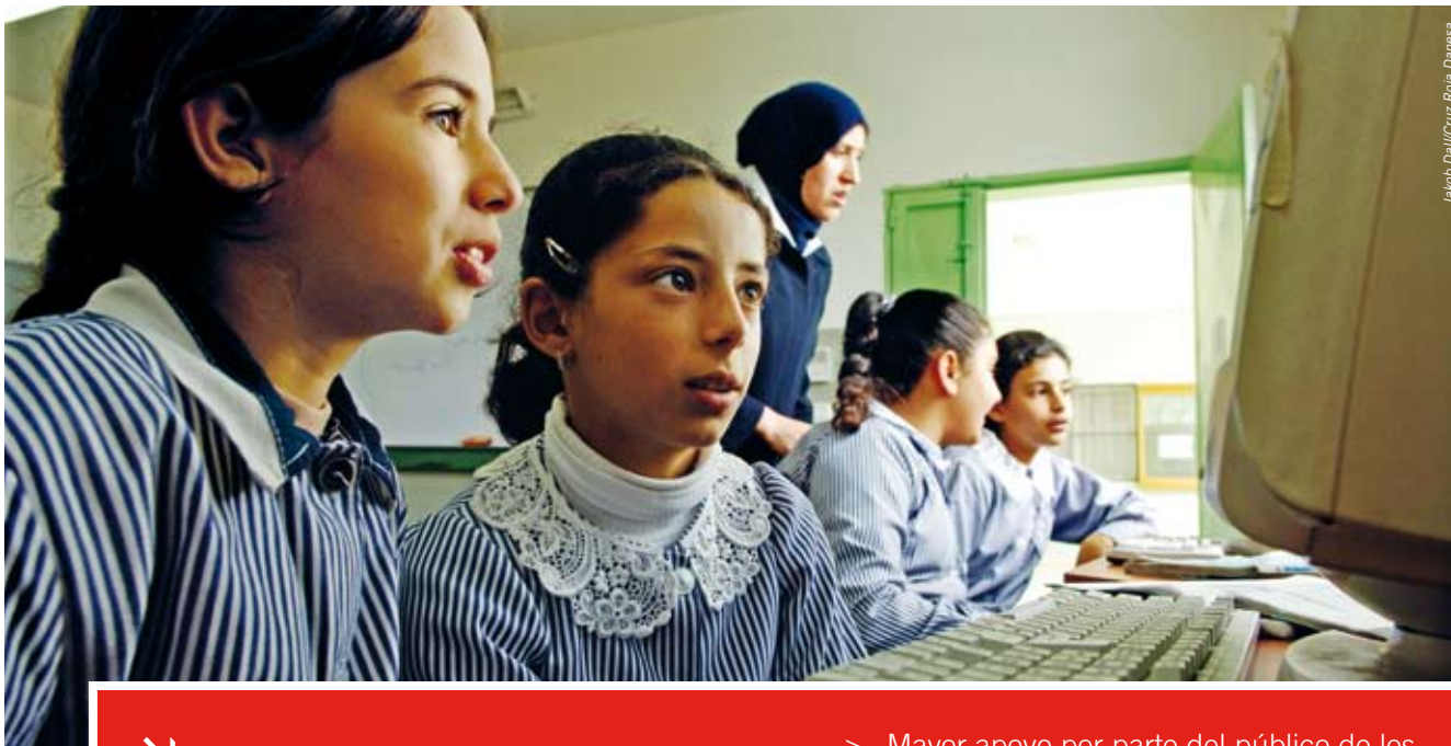
Jawab Dallah Cruz Roja Danesa

del público. Esto comprende promover el respeto de los convenios de derechos humanos específicos para personas desfavorecidas, y facilitar su acceso a servicios más abiertos y más adaptables de salud y seguridad social.