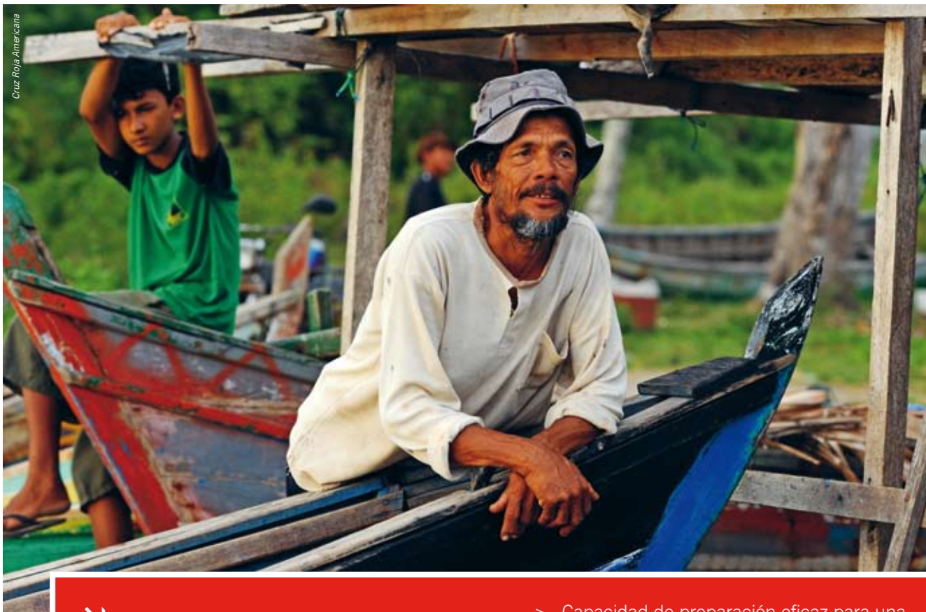
Cruz Roja Americana

la capacidad de respuesta en casos de emergencia. En virtud de los Estatutos, la secretaría tiene la obligación de “organizar, coordinar y dirigir las acciones internacionales de socorro” entre los servicios básicos que presta a los miembros de la Federación Internacional. Aprovechando las capacidades complementarias de las Sociedades Nacionales, aseguramos que en todo momento estén disponibles instrumentos eficaces y capacidades de acción fiables, a través de un enfoque sin fisuras que conecta los planos mundial, regional, nacional y local. Esto nos da la confianza necesaria para enfrentar el aumento probable de la cantidad y la magnitud de los desastres de gran envergadura en todo el mundo. La Federación Internacional y el CICR cooperan de manera coordinada para mantener capacidades sustanciales para brindar protección y asistencia a las personas afectadas por conflictos armados y violencia.